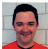
SVEN, BESCHUTTE WERKPLAATSEN

Sociale dumping is een groot probleem: moderne slavernij. Neem nu de bekisters: in België houden we rekening met belasting voor de werknemers. Maar voor gedetacheerde werknemers gelden die regels niet. Integendeel ze worden betaald per ton. De omzetting van de nieuwe Europese richtlijn over openbare aanbestedingen bood kansen om het probleem aan te pakken. Want 40% van onze werven zijn openbare werken. Maar deze regering liet die kans liggen. Ze vonden het niet nodig om sociale regels op te stellen voor de aanbesteding van openbare werken.