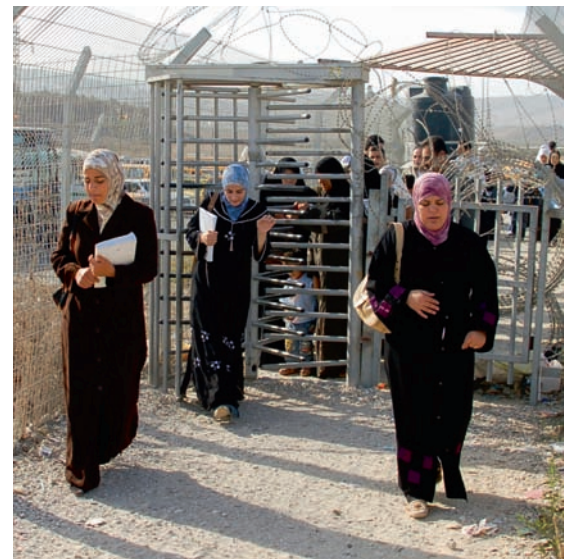
■ De Palestijnse bevolking gaat al 50 jaar gebukt onder de Israëlische bezetting. Dat heeft de arbeidsmarkt volledig ontwricht. Werknemers moeten soms uren lang aanschrijven aan checkpoints. Europese vakbonden richten een netwerk op om de EU onder druk te zetten daar iets aan te doen.

Het wintervakantiegeld zal uitbetaald worden in de week van 9 december. Wie op 16 december nog niets ontvangen heeft kan contact opnemen met de Rijksverlofkas voor de Diamantnijverheid via het telefoonnummer 03 213 50 30.