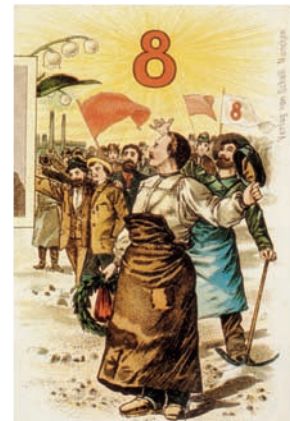
Grote manifestatie in Chicago, Verenigde Staten, voor de invoering van een achturige werkdag

De traditie zet zich voort. Over heel de wereld verenigen werknemers zich op 1 mei voor betere werkomstandigheden. In België richt het ABVV al haar inspanningen op 'Fight for €14', de strijd voor een verhoging van het minimumloon van €9,65 naar €14 per uur of €2.300 per maand.