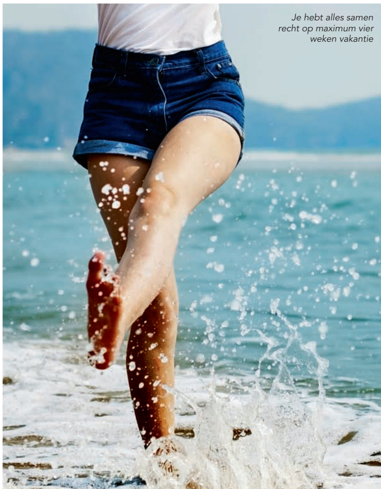
Je hebt alles samen recht op maximum vier weken vakantie

Je hebt natuurlijk recht op het gewone vakantie-geld en de gewone vakantiedagen, berekend op het aantal gewerkte dagen in het jaar dat je je studies hebt beëindigd. Die moet je eerst opmaken. Daarnaast heb je recht op een aantal bijkomende vakantiedagen met een jeugdvakantie-uitkering, betaald door de RVA. Je hebt alles samen recht op maximum vier weken. De uitkering bedraagt 65 procent van het gemiddelde dagloon dat je verdient juist voor je eerste opgenomen jeugdvakantiedag. Dit bedrag krijg je dan ook voor alle andere jeugdvakantiedagen die je nog opneemt. ■