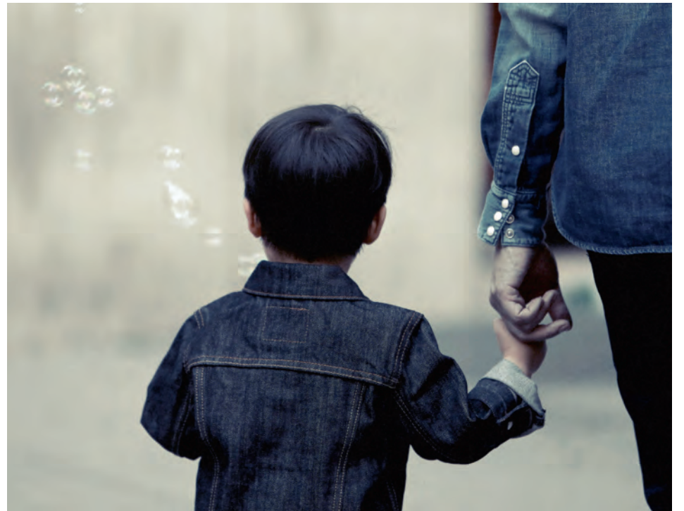
■ Eén op acht Vlaamse kinderen groeit op in een kansarm gezin dat leeft onder de armoedegrens