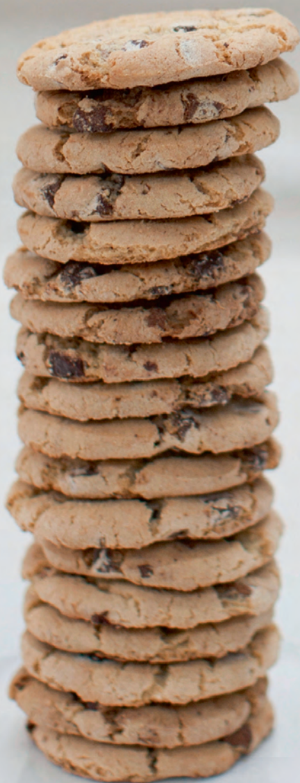
■ De begroting van de regering-Michel staat voor averechtse herverdeling

Nadat zij de jongeren van onder de 21 zonder diploma hun inschakelingsuitkeringen afgepakt heeft, de concurrentie tussen jobstudenten en gewone jonge werknemers aangewakkerd heeft, voegt de regering er nog een discriminatie aan toe: een leeftijdsgebonden discriminatie.