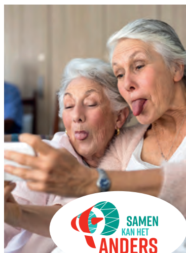
ZORGELOOS OUD WORDEN