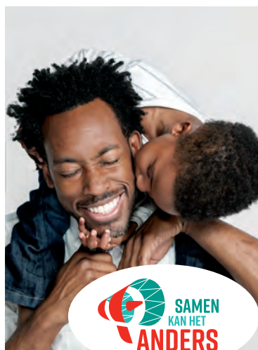
MEER TIJD GRAAG