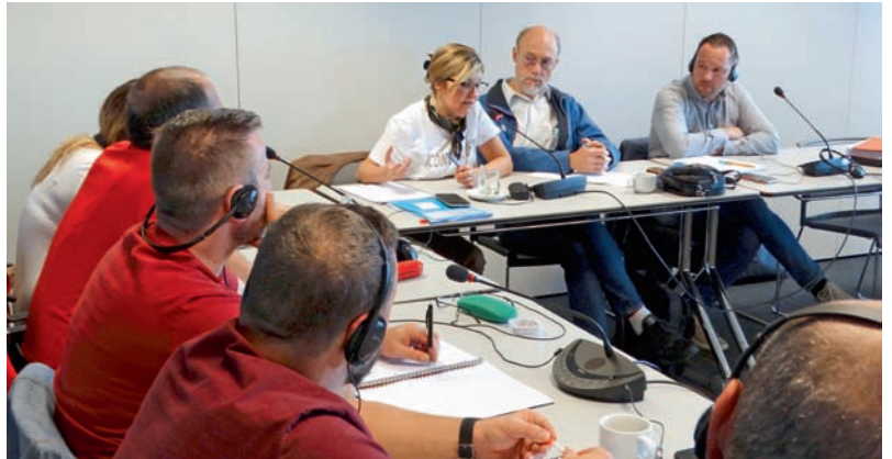
Voortreffelijk syndicaal werk wist het ergste te voorkomen, maar waakzaamheid is geboden, dat bleek onder meer tijdens de laatste syndicale raad van ABVV Scheikunde.

Een sociaal conflict bij Air Liquide deed de directie van dit chemisch bedrijf onlangs besluiten haar herstructurering in de koelkast te steken. Solidariteit onder werknemers overal te lande wierp vruchten af.